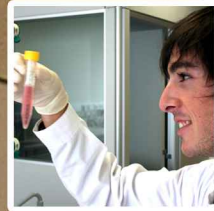
Análises Clínicas e Saúde Pública