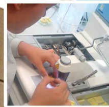
Anatomia Patológica, Citológica e Tanatológica